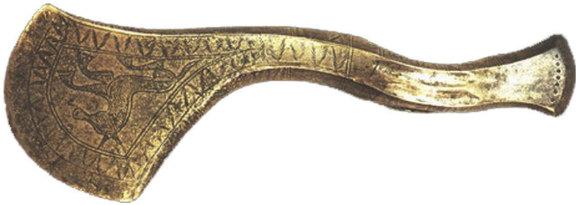
M.Ö 8. yüzyıl sonlarına ait bir Kolhi bronz savaş baltası. (Borjomi Müzesi) (Haritada:K2)

belirttiği gibi, Urartu'dan, Doğu Akdeniz'e oradan da Ege Denizi'ne kadar taşıyacaktı. Bu dilden dile aktarımın doğal bir sonucu olarak da, gerçeklikten yarı efsane haline dönüşen bu altın zengini, gizemli ülkenin ismi, bir sonraki yüzyılda, büyük tekneler inşa ederek deniz aşırı seyahatlere girişecek olan Yunan denizciler için, en cazip macera hedeflerinden biri olacaktı. Kolha seferlerinin, Urartu devleti açısından sonuçları da ayrı bir inceleme konusudur. Zira, Urartu ordusunun, gücünün doruk noktasındayken giriştiği bu seferlere kaç kişilik bir kuvvetle çıktığını, ne kadar kayıp verildiğini ve geriye ne kadar kişinin dönebildiğini, Urartu resmi propaganda metinlerinden öğrenebilmek mümkün görünmüyor. Ancak bilinen bir tarihi gerçek şu ki, Urartu devleti, bu seferleri izleyen tarihlerde asla eski gücüne ulaşamamış ve hızlı bir zayıflama sürecine girmiştir. Kolha seferlerinin ardından, II. Sarduri döneminin sonlarına doğru, ağır yenilgiler ve hezimetler üst üste gelmeye başlamış ve M.Ö 730 yılına doğru Urartu tahtına geçen Rusa döneminden itibaren de, artık Urartu devleti için çöküş süreci başlamıştır.